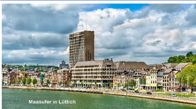
Maasufer in Lüttich