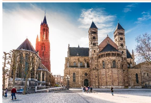
Vrijthof im Zentrum von Maastricht

Das Konzert beginnt am 12. Juli um 21.00 Uhr – zuvor 1 St. festliche Marschmusik und dauert bis nach Mitternacht. Das Geschehen auf der Bühne wird auf Videoleinwände an der Seite übertragen. Mittendrin gibt es eine Pause. Wir haben reservierte Plätze im Block „C2/Reihe 16“ links von der Mitte (zweitbeste Kategorie/€ 85,-). Das Konzert findet auch bei Regen statt.